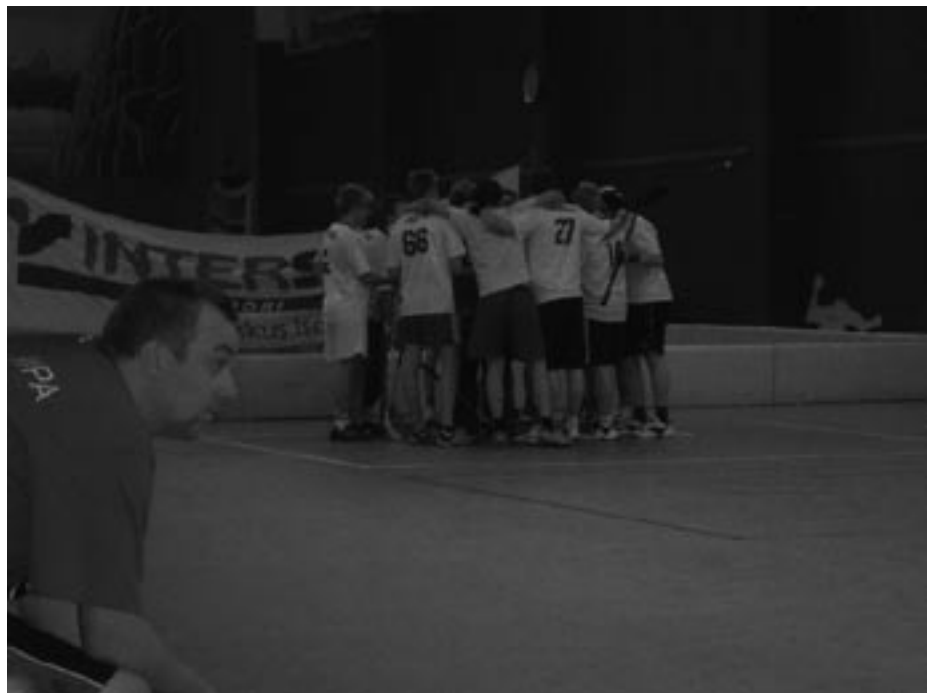
BFC:n joukkue keräämässä yhteishenkeä ennen finaalin alkua.

Siitä huolimatta HPK:n pelaajan oli onnistuttava kolmannella kierroksella. Muutoin BFC etenisi finaaliin. HPK oli jättänyt kolmanneksi laukojaksi parhaan pelaajansa, joka oli voittanut urallaan kaikki mahdolliset palkinnot. Hän lähti kuljettamaan palloa täynnä itsevarmuutta ja määrätietoisuutta. Hän saapui pallon kans-