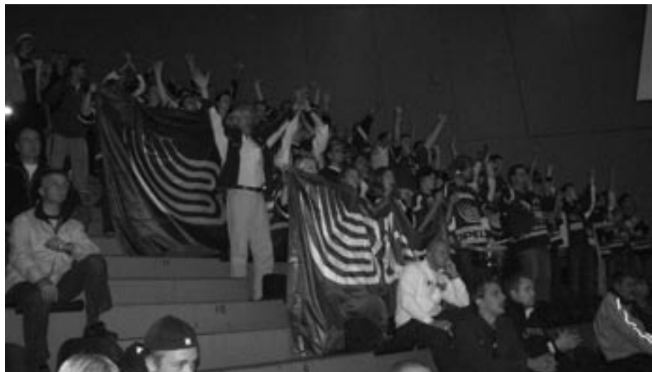
14.9.2006 Pelicans-Blues 3-6

Ensimmäinen peli, ensimmäinen fanimatka ja Pelsut nurin lukemin 3-6. Pelin jälkeen bussissa tunnelma oli odotetusti vapautunut ja iloinen. Jostain olin myös kuulevinani erään