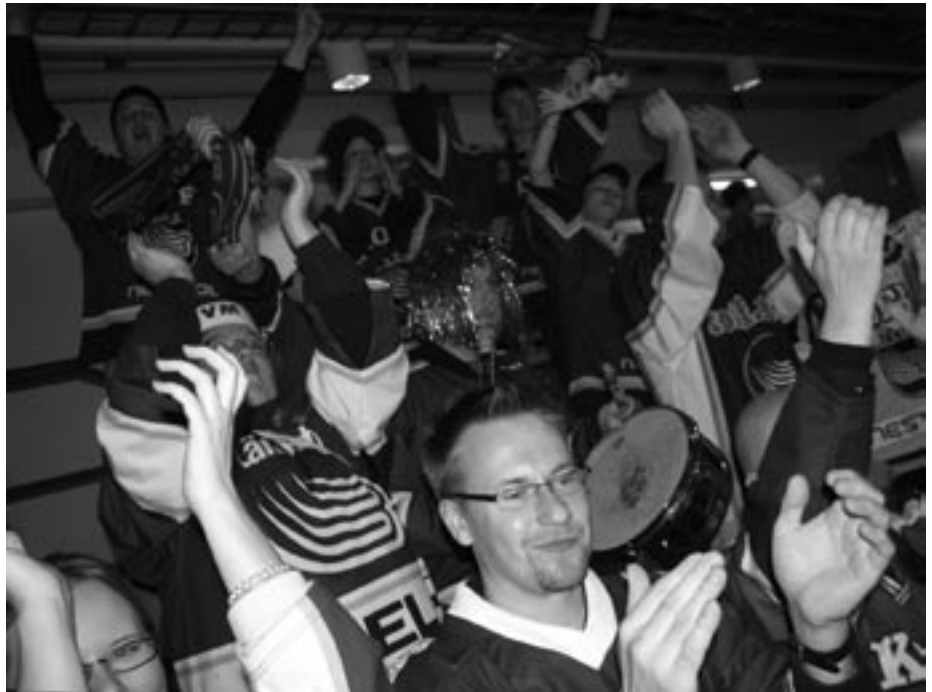
21.10.2006 SaiPa-Blues 0-7

Pudotuspeleissä pyritään järjestämään jokaiseen vieraspeliin fanimatka.