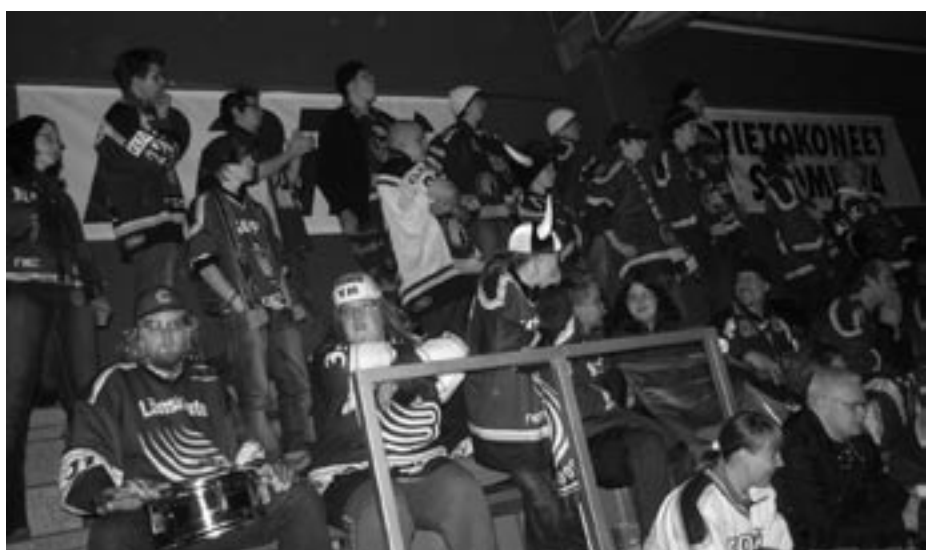
18.11.2006 Kärpät-Blues 1-2 ja.