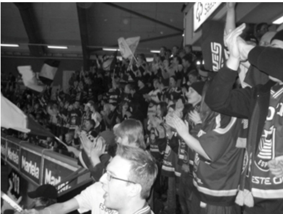
Hämeenlinnassa oltiin kolmen bussilastillisen voimin