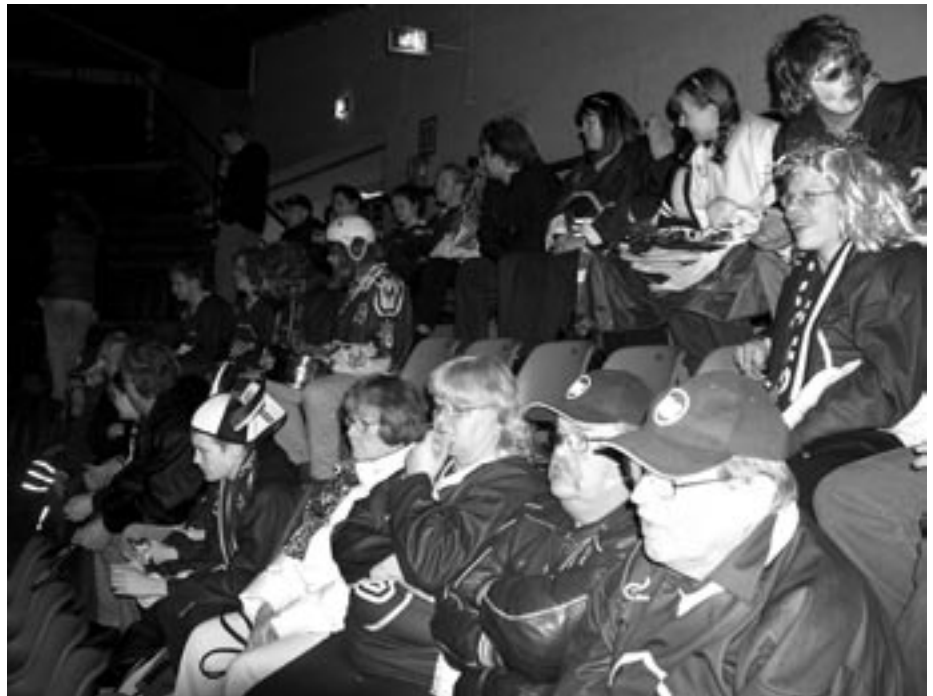
Play-Off -huumaa keväältä 2004

nut viimeistään puolivälierissä, Kieko-Espoo tosin kerran pääsi hienosti välieriin asti. Bluesilla ei ole vielä yhtään SM-mitalia, mutta paikka välierissä antaisi teoriassa tähän hyvin todennäköisen mahdollisuuden.