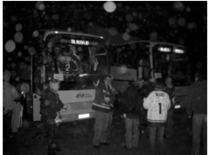
Kotia kohti, 6.1.2007 HPK-Blues 5-4 ja.

Kiekkokauden toinen puolikas on jo käynnistynyt ja pudotuspelit ovat melkein ovella.