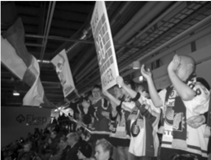
Kannustusta Kisapuistoissa, 13.1.2007 SaiPa-Blues 4-2