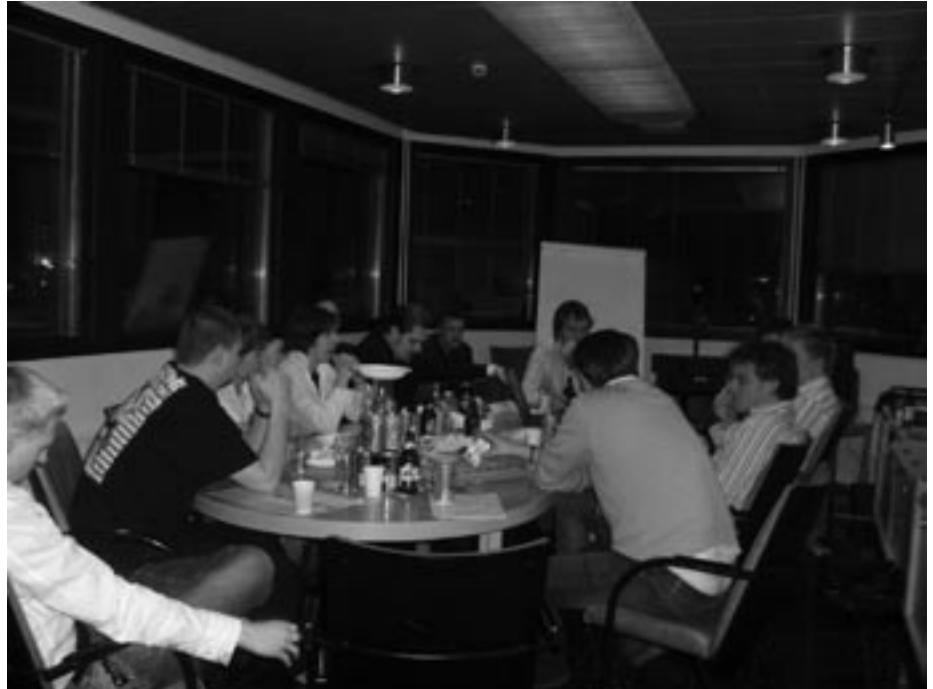
Tiukkaa keskustelua ensi kauden pelaajahankinnoista.

Edellä mainittujen lisäksi pelaajavalmentaja Janne Kumpuniemi halusi nostaa esille myös muita onnistujia.