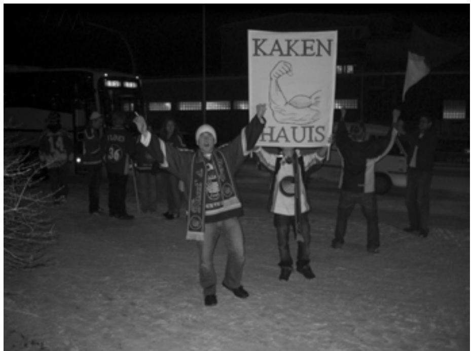
Kaken hauis näkyi Lahdessa.

Kaksi hyvin nukuttua yötä ja seuraava matka edessä. Vastassa idän SaiPa. Tämä matka jäi väliin omalta osalta, mutta kommenttien perusteel-